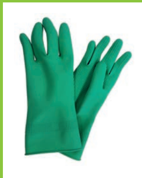
Gummihandschuhe, der Klassiker aus Gummi, für perfekten Grip

Die Grundlage für einen einfachen Umgang mit Kompressionsstrümpfen bilden Spezialhandschuhe. Durch den Grip wird das Überstreifen des Strumpfes über den Knöchel vereinfacht, und der Strumpf lässt sich besser am Bein verteilen.