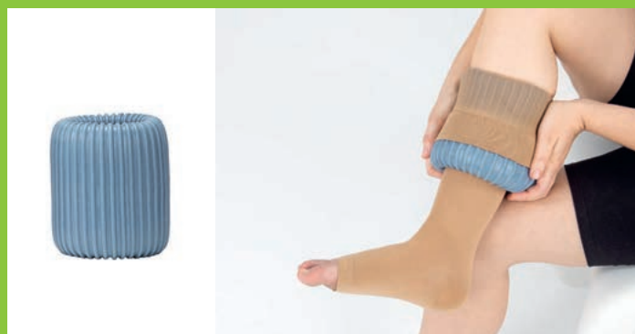
DOFF N' DONNER, die ideale Unterstützung fürs Pflegepersonal

Besonders für Personen mit eingeschränkter Beweglichkeit eignet sich die neue An- und Ausziehhilfe MELANY von SIGVARIS. Durch die spezielle Konstruktion ermöglicht sie Personen, die den Fuss nicht mit der Hand erreichen können, das selbstständige An- und Ausziehen der Strümpfe. Dieses Rahmengestell erhöht die Selbstständigkeit und vereinfacht den Umgang mit den Kompressionsstrümpfen.