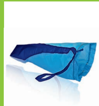
magnide on/off, die Hilfe für Kompressionsstrümpfe mit geschlossenem Fuss