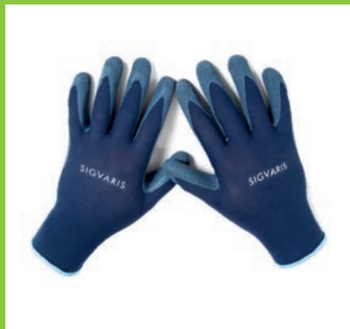
Textilhandschuhe mit textilem, atmungsaktivem Gestrick und einer griffigen Latexbeschichtung