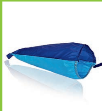
sim-slide, für Kompressionsstrümpfe mit offenem Fuss

Sogenannte Gleithilfen sind die optimale Ergänzung zu den Spezialhandschuhen und eignen sich für bewegliche Personen und auf Reisen. Die Gleithilfe wird einfach über den Fuss gestülpt und der Strumpf anschliessend darüber gestreift. Durch das gleitfähige Material rutscht der Strumpf schnell und ohne Reibung über den Fuss.