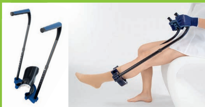
MELANY verbessert die Selbstständigkeit mit wenig körperlicher Belastung